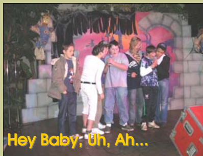
Hey Baby; Uh, Ah...