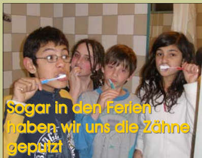
Sogar in den Ferien haben wir uns die Zähne geputzt