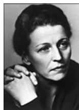
Pearl S. Buck US-amerik. Schriftstellerin und Nobelpreisträgerin

Da haben sie was verpasst! Was die Er.Ste. Trägergesellschaft mit der Fabrik zu tun hat, erfahren sie in der nächsten Ausgabe des Quartalsbriefes!